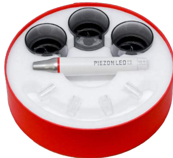
Com 3 pontas PS