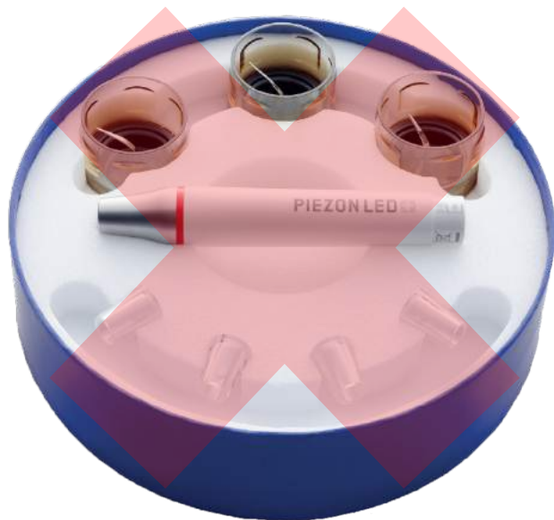
Com as pontas A, P e PS

Fornecido a partir de agora com 3 pontas PS (em vez das pontas A, P e PS)