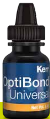
OptiBond Universal Botella 5ml

Con más de 20 años de éxito clínico en todo el mundo, la marca OptiBond es un modelo de referencia en adhesión, con resultados fiables y soluciones orientadas al cliente.