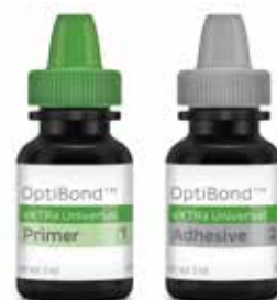
OptiBond™ eXTRa Universal Agente adhesivo universal de dos componentes

Sea uno de los primeros en probarlo: www.kavokerr.com/pruebe-eXTRa